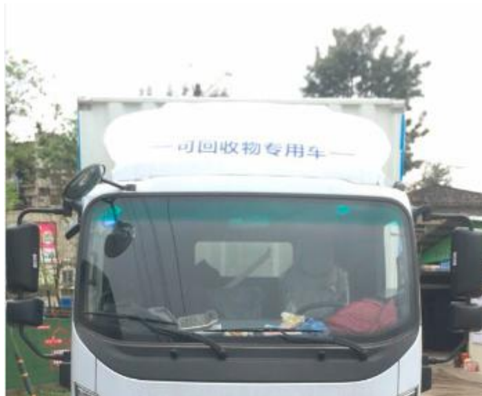
车头显著位置有“可回收物专用车”字样