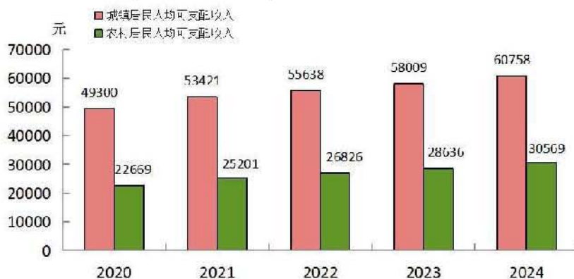
图 7 2020-2024 年居民人均可支配收入

全年居民人均生活消费支出 36363 元，比上年增长 6.3%。按常住地分，农村居民人均生活消费支出 24799 元，增长 6.6%；城镇居民人均生活消费支出 41510 元，增长 6.0%。