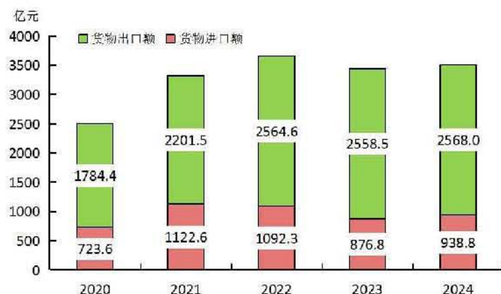
图 6 2020-2024 年货物进出口总额

全年进出口总额 3506.9 亿元，比上年增长 2.1%。其中，出口额 2568.0 亿元，增长 0.4%；进口额 938.8 亿元，增长 7.3%。