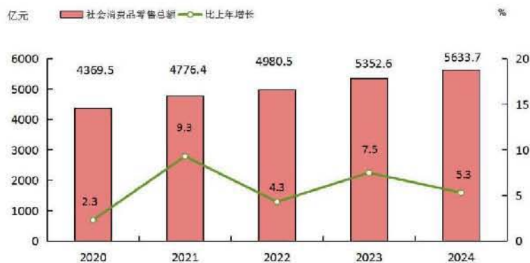
图 5 2020-2024 年社会消费品零售总额及其增长速度

全年社会消费品零售总额 5633.7 亿元，比上年增长 5.3%。限额以上零售总额按经营地统计，城镇消费品零售额 2132.3 亿元，增长 5.4%；乡村消费品零售额 123.3 亿元，增长 23.4%；按消费形态统计，商品零售额 1978.2 亿元，增长 6.0%；餐饮收入 277.3 亿元，增长 7.6%。