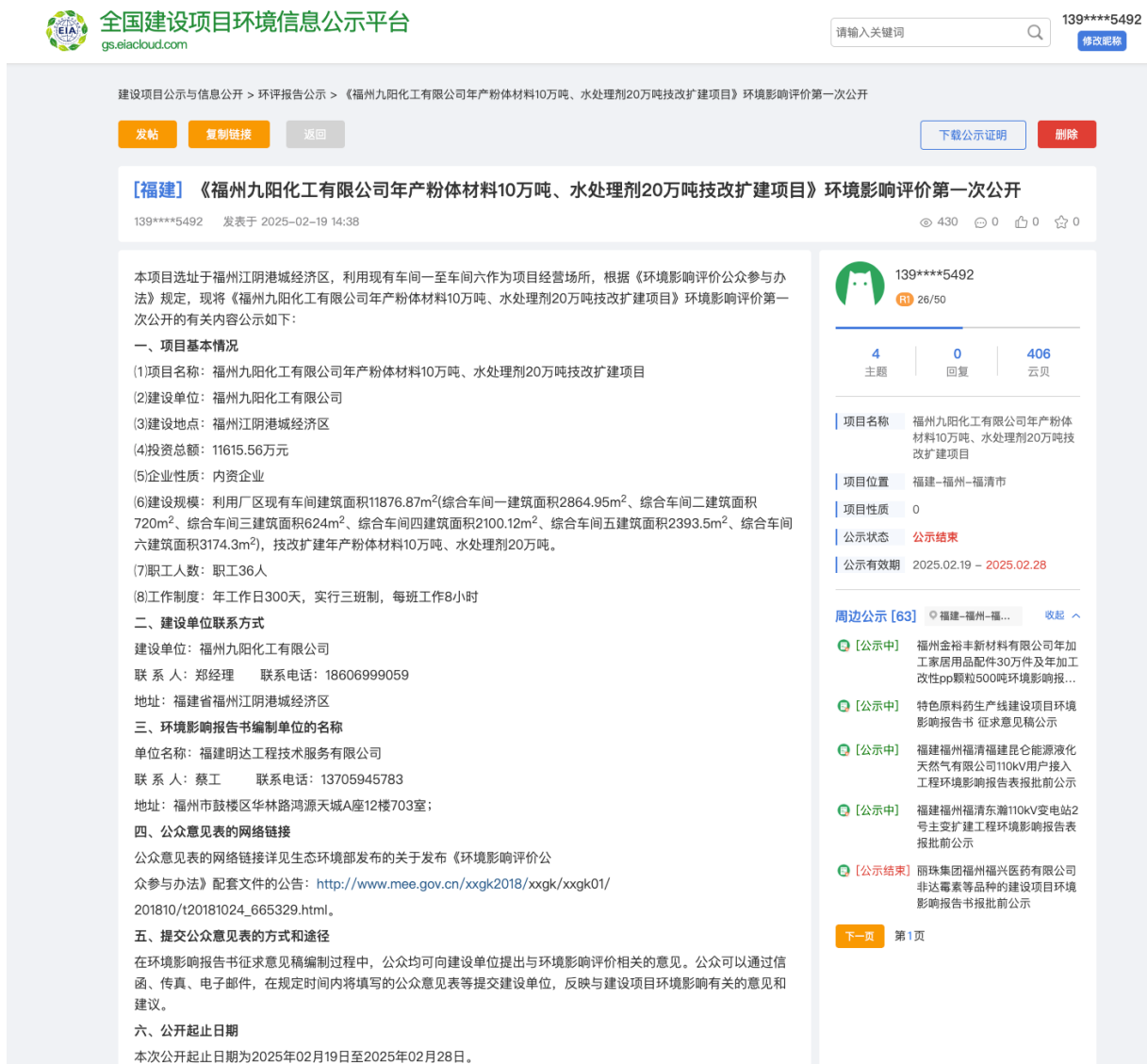
图1 网络第一次公示截图