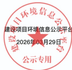
图 2 网络第二次公示截图