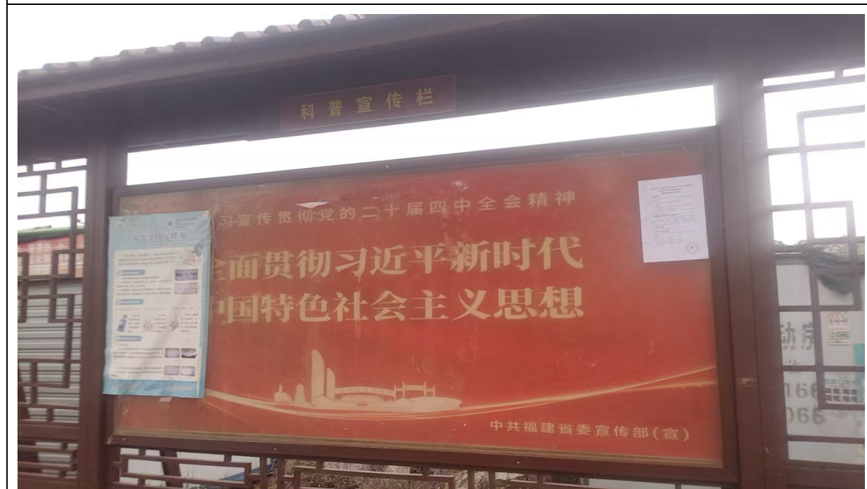
南曹村村委会公告栏